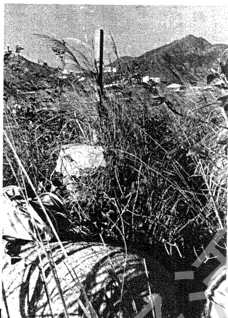
印洲塘因以爲名之印洲