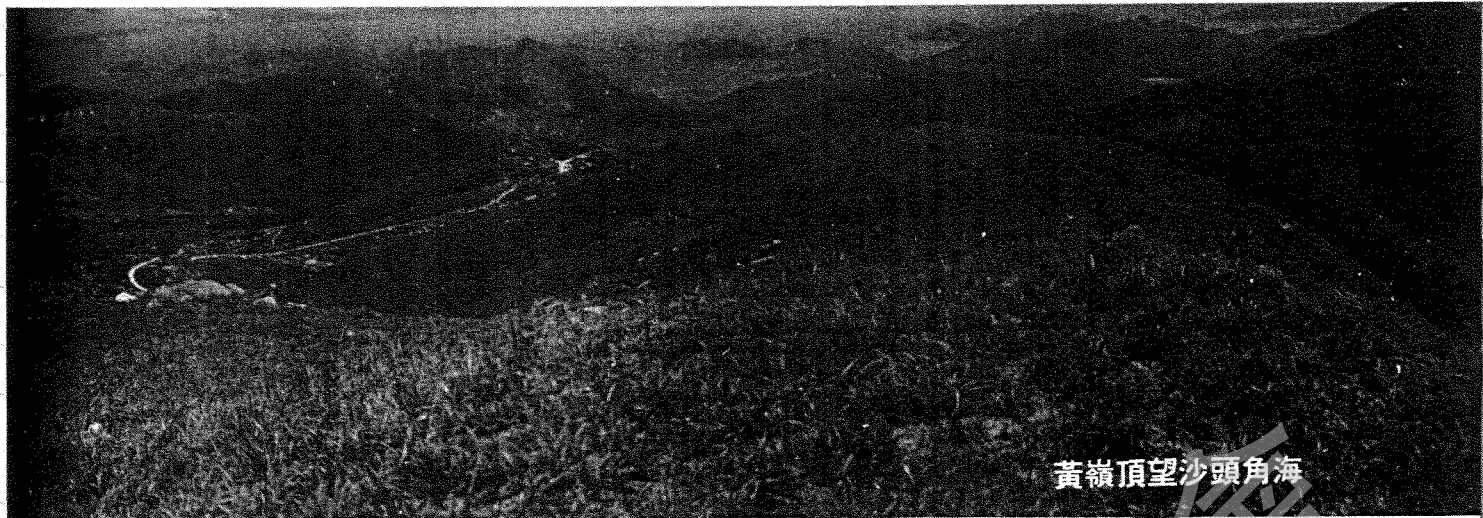
黃嶺頂望沙頭角海