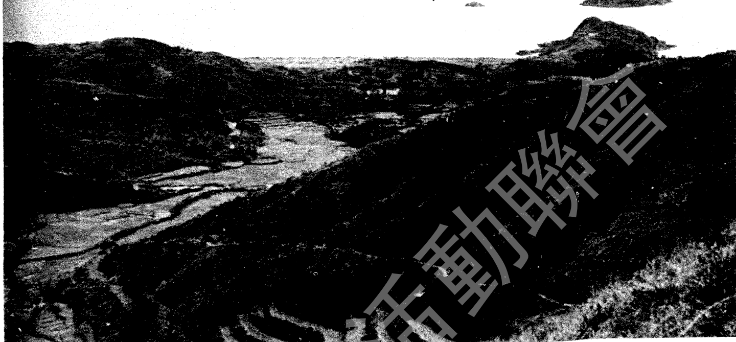
從大浪坳望大浪灣，上佳營地，不可勝數