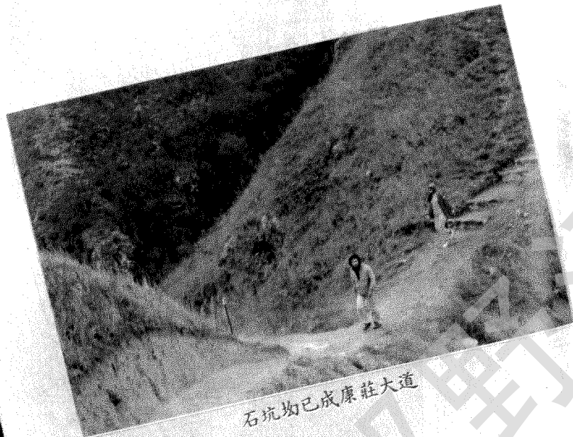
石坑均已成康莊大道