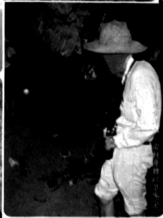
行友手持色表內蝙蝠