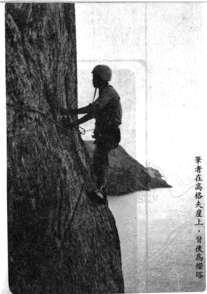
筆者在高格夫崖上，背後為燈塔