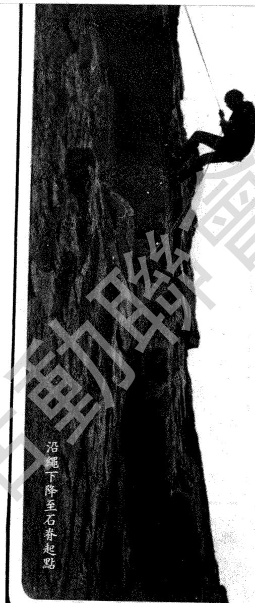
沿繩下降至石脊起點