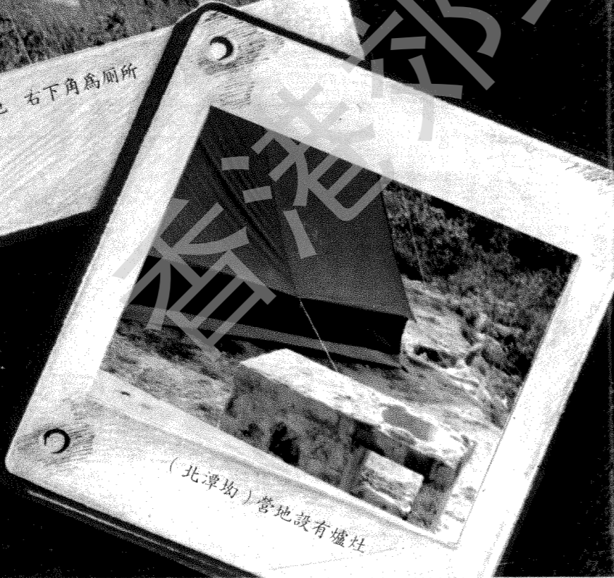
(北潭坳)營地設有爐灶