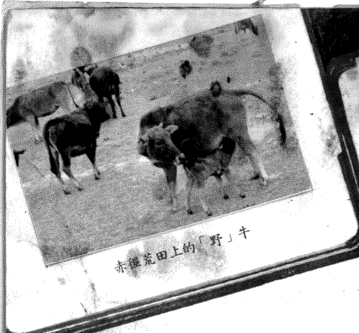
赤徑荒田上的「野」牛