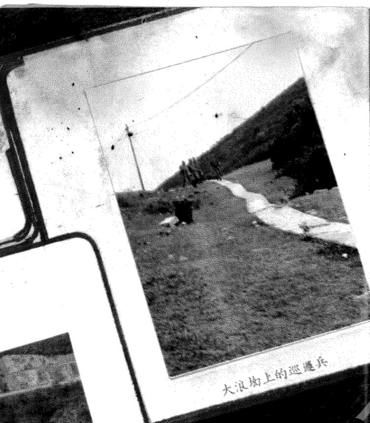
大浪坳上的巡邏兵