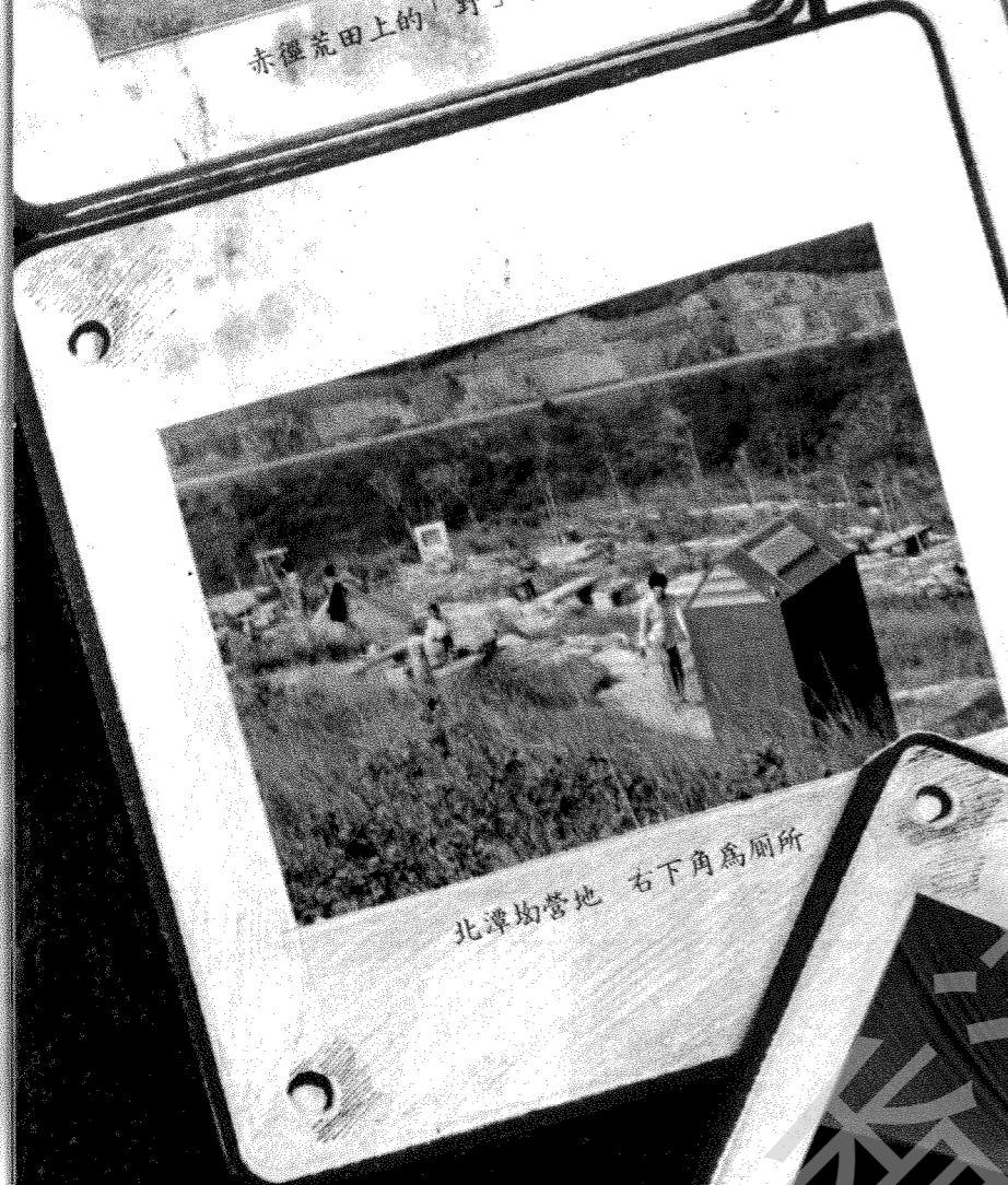
北潭坳營地 右下角為廁所