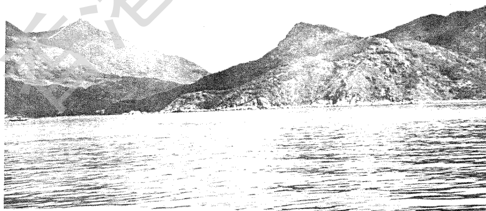
芝麻灣半島老人山