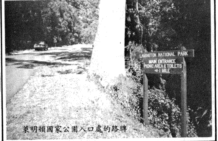
萊明頓國家公園入口處的路牌

場租了車駕駛入市區時更不知所措。不過這城市地臨庇理斯本河，風光如畫，雖時當澳洲冬季，但這裏仍氣候和暖，陽光遍地，很值得一遊。而庇理斯本北郊的陽光海岸(Sunshine Coast)和南郊的黃金海岸(Gold Coast)都是澳洲有名的渡假和滑浪勝地，遊客眾多。在庇理斯本附近山區的國家公園我們到過了其中一處的萊明頓(Lamington)國家公園(附圖三)，在這裏的自然教育徑漫步時曾見到野生的小袋鼠在樹林裏跳來跳去，我們在公園內的野餐椅上午餐時，一些不知名的鳥羣