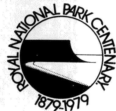
澳洲皇家國家公園一百週年紀念章

在雪梨期間，曾花了大半天時間去遊過其南郊的「皇家」國家公園 (Royal National Park)，這公園佔地近一萬五千公頃，在一八