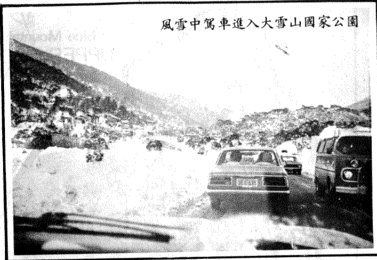
風雪中駕車進入大雪山國家公園