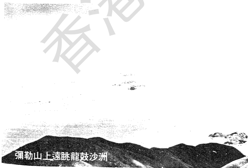
彌勒山上遠眺龍鼓沙洲

亦可作一日遊。所謂小遊，指登臨叮嚀石俯覽昂坪及遠眺澳門後，即折回昂坪而言，欲作半日遊，則可自南坡登山，先遊叮嚀石，漫步至東北峯轉登山頂，於飽覽四週景色後自東向山脊下山。此處多方外人仕之骨塔等建築物，市區難得一見。路止於鳳凰山與彌勒兩山之山坳。此坊為自東涌上昂坪必經之路，由此可轉過茶場回寶蓮寺。如欲以一日時間遊此山，應自東涌過碼頭登岸，橫過海邊至東涌谷西北之磳頭村，於村後登山，沿脊而上，遊賞山頂後取西脊下深窟，或逕下昂坪乘車歸，至自深窟灣後上攀彌深石澗登昂坪上山、斜下東涌，則非有識途者引路，不易成行。