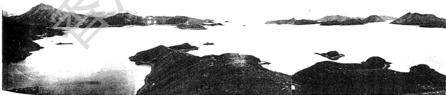
攝於往灣七樹環頂

曾有一只識遠遊歐美澳亞而不知賞覽香港之人仕，於一次偶然機會下自紅石門放舟入印洲塘以趨吉澳，目睹湖光山色後，作出一「瑞士之日內瓦湖較印洲塘猶遜一籌」之評語，是則此區之風光如何，思過半矣。