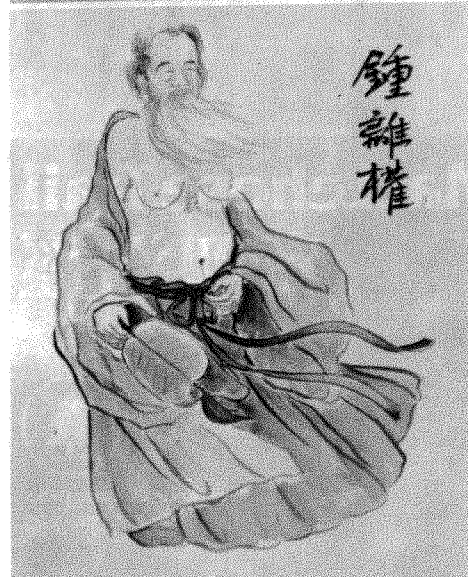
八仙嶺與中心內陳列之八仙羣像