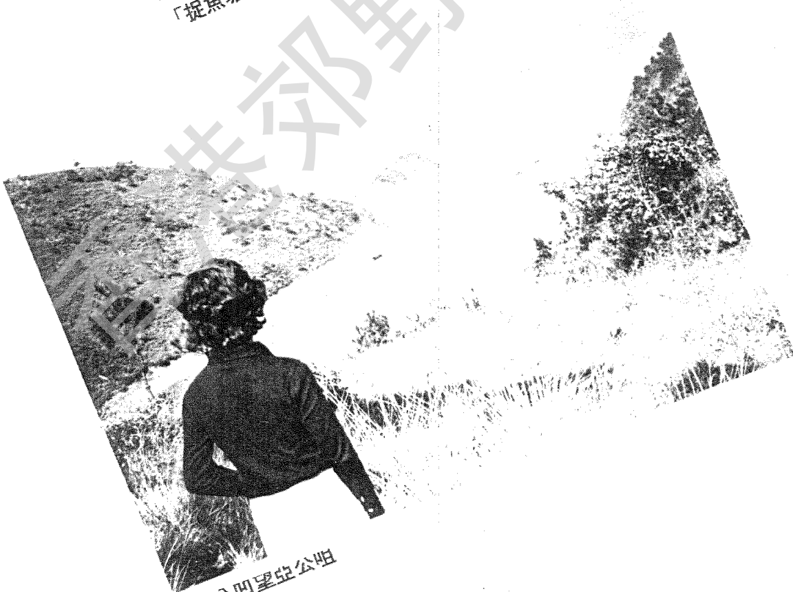
從亞公凹望亞公咀