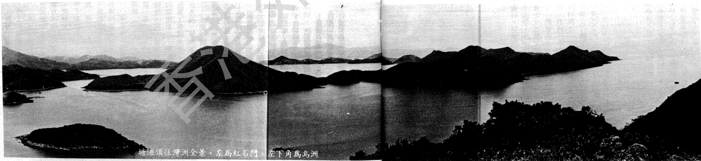
塘邊頂往灣洲全景，左為紅石門，左下角為烏洲