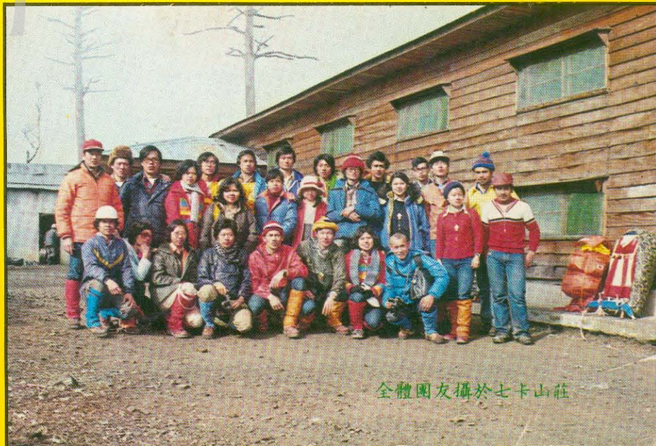
全體團友攝於七卡山莊