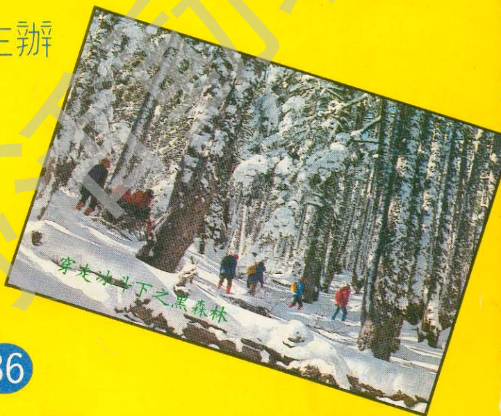
穿過冰斗下之黑森林