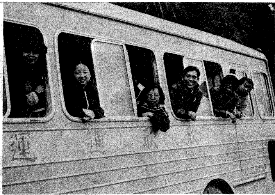
滿載歡欣的遊覽專車

霄的歡呼。 廣州酒家內飽餐粵式戰飯，經過三翻研討，在蘇花地區渡過十二年駕車生涯的司機也表