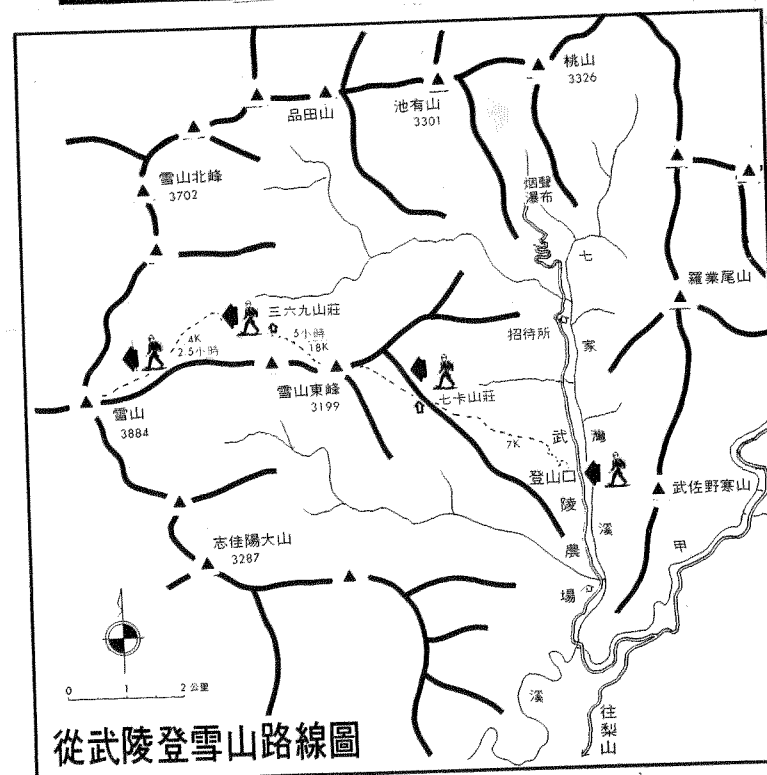
從武陵登雪山路線圖

武陵為雨量頗多之處，每年平均降雨量為3,000~4,500公厘，氣溫夏季平均為16度左右，冬季標高1,000公尺以上降霜，2,000公尺以上偶有降雪，3,000公尺以上常有結冰。