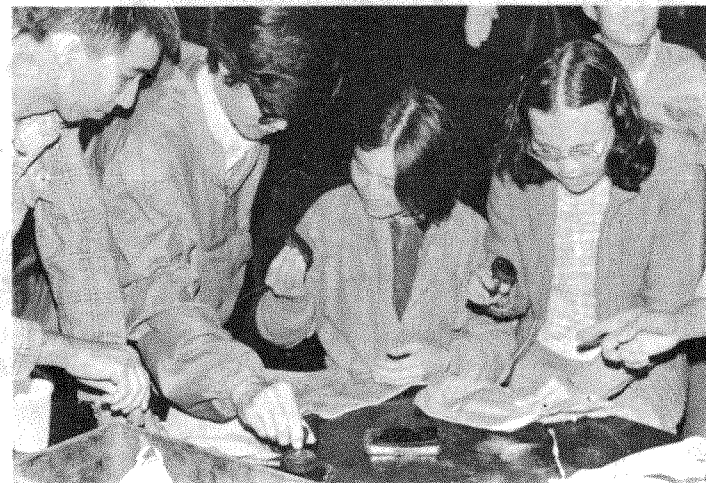
九九山莊內蓋上紀念印戳

第二天，我們在晨光曦微中出發，四面廣闊山林，連連山脈遍插茂密的柏樹。風吹過，柏枝齊齊舞動，一派歡欣景象。到了三〇五〇高地開始看到大小霸，就在東南偏東。此時氣溫已降至十二度，寒風凜烈，大小霸夾着勁風