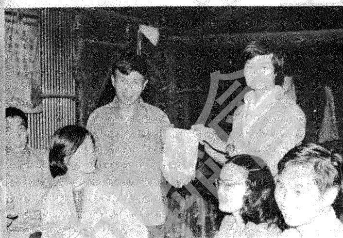
團長與莊主互贈錦旗及野外月刊

不過一尺，頭上不時悉悉瀝瀝的洒下岩泉，石面滑，谷底深，滿谷盡是風化剝落時掉下的大小石塊。我連大氣不敢透一口。十時四十五分，我們在通往大小二霸的叉路用午餐——又是冰冷的「便當」（即飯盒）。稍作休息，卸下重裝，抖出行囊裏最保暖的外衣，有人穿太空襪，有的團友穿上羽毛衣，搶眼之至。總之是全副武裝，坡上最厲害的盔甲，作好心理準備，「跟大霸尖拼去！」