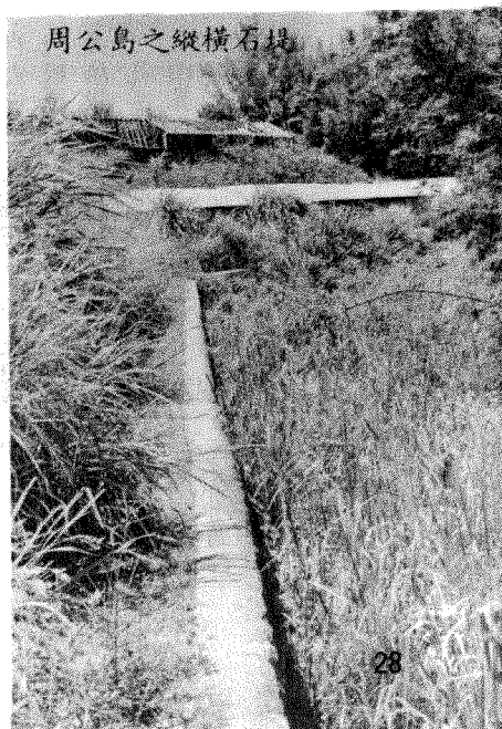
周公島之縱橫石堤

樹木地帶，不易穿越，西北部有小徑斷續相連。第三峯之山坡有連綿相間，高四五呎、寬二呎許之矮石牆，未知原來之用途為何。