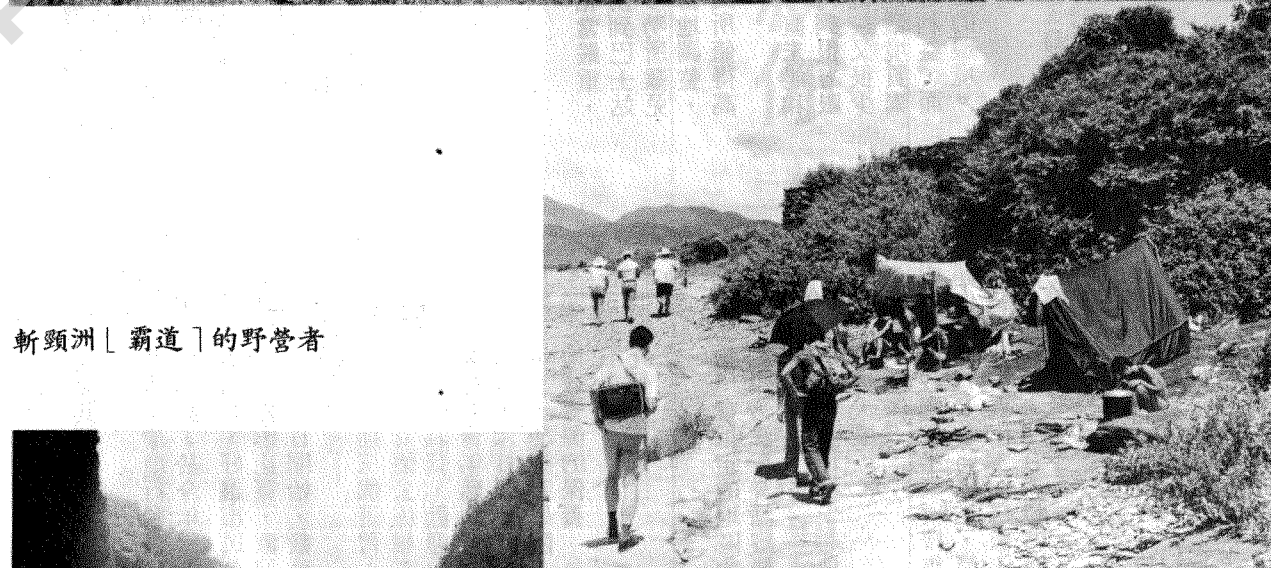
斬頸洲「霸道」的野營者