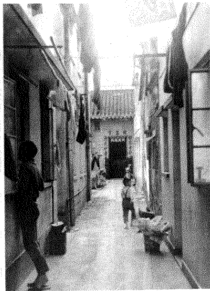
深巷王宮（大圍村內積存圍）