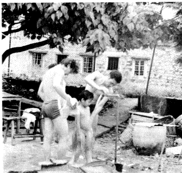
高井上之另一「水源」——汽水檔