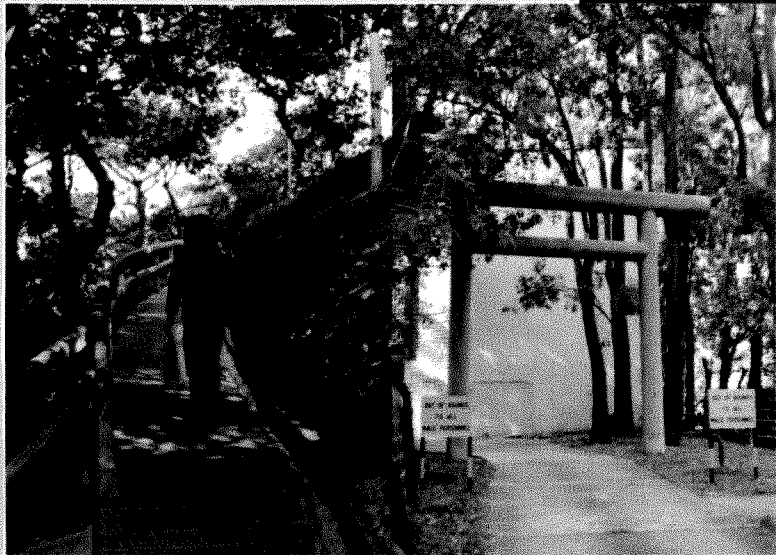
兵房內之林蔭步道