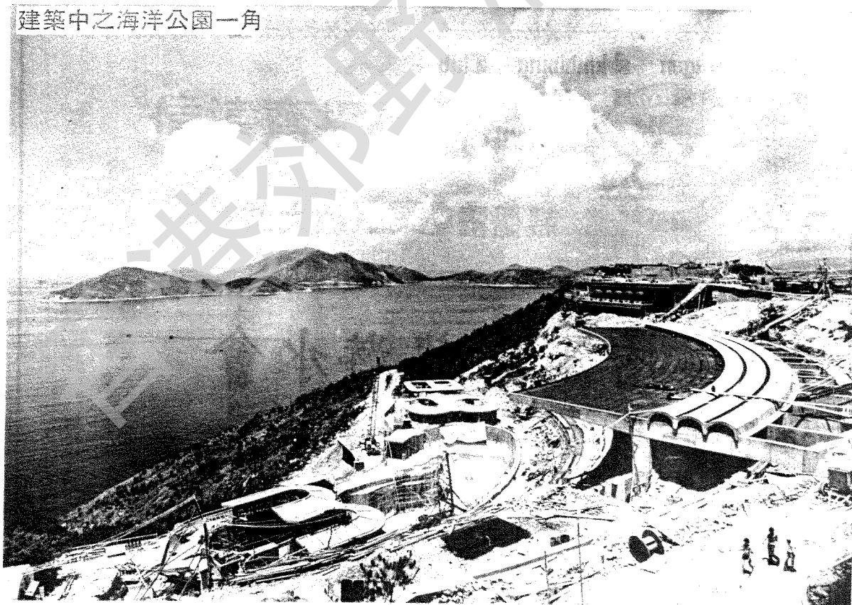
建築中之海洋公園一角