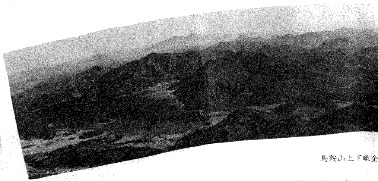
馬鞍山上下瞰企嶺下及西貢兩海

地面時始轉為平順。自大埔海及赤門海峽仰望，此脊如一刀脊，兩側一落千丈，形勢極為險峻，幸脊上滿長高矮雜樹，一徑貫通，遊人置身其間，如在林中，不覺身處險地。 馬尾脊年來已成第三條登馬鞍山之路線，此線因步崎過甚，較宜仰攀，自山麓路胚上仰望，全脊走勢展現，上山路口即在路旁山邊，略一尋覓即得，小徑曲折而上，引至一高近千呎，草長及腰間有松樹之平脊，平脊以上，山路斜升，漸高漸陟，而茅草漸高，矮樹叢生，坡斜路滑，需扶樹捫枝而上，此段為全脊最陟之一節，小徑在矮林中轉折而登，半山以上，雜樹轉密，遮蔽天日，大抵右方樹密不可透視，而左方則可於樹隙間窺見直瀉千丈之山勢，待轉至一山崗之頂，已近馬鞍北峯，前行過一平脊斜行而上，即至馬尾，此一路線上行約需兩小時，下行則因坡度傾斜，多段路上需半行半衝而下，故需時較少，在普通情況下，六十至八十分鐘之內，即可自山頂降至山麓車路之上。