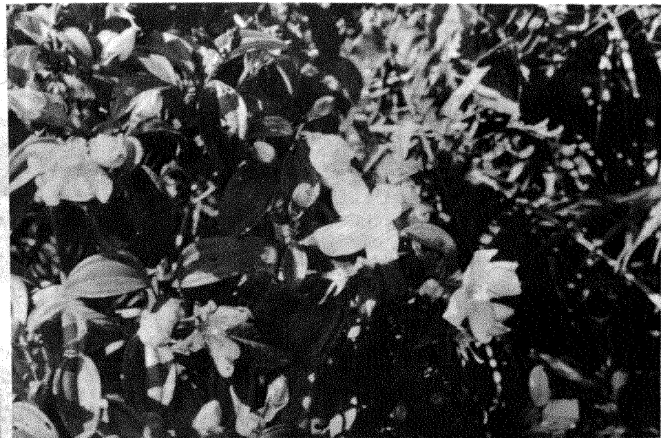
①中華野海棠 ②野海棠之異型小蕊 ③野海棠示萼之四枝