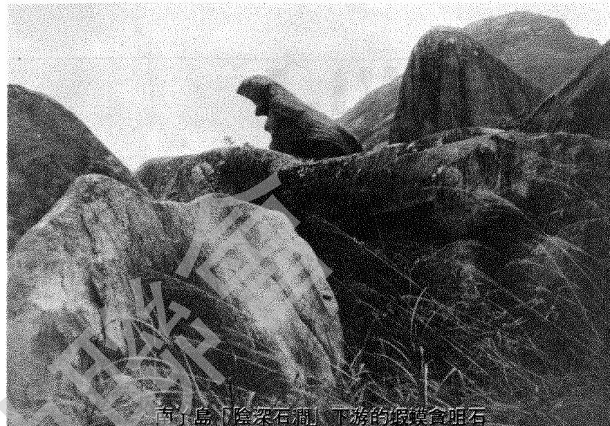
石明合鎮蝦下游「瀾石深陰」島南