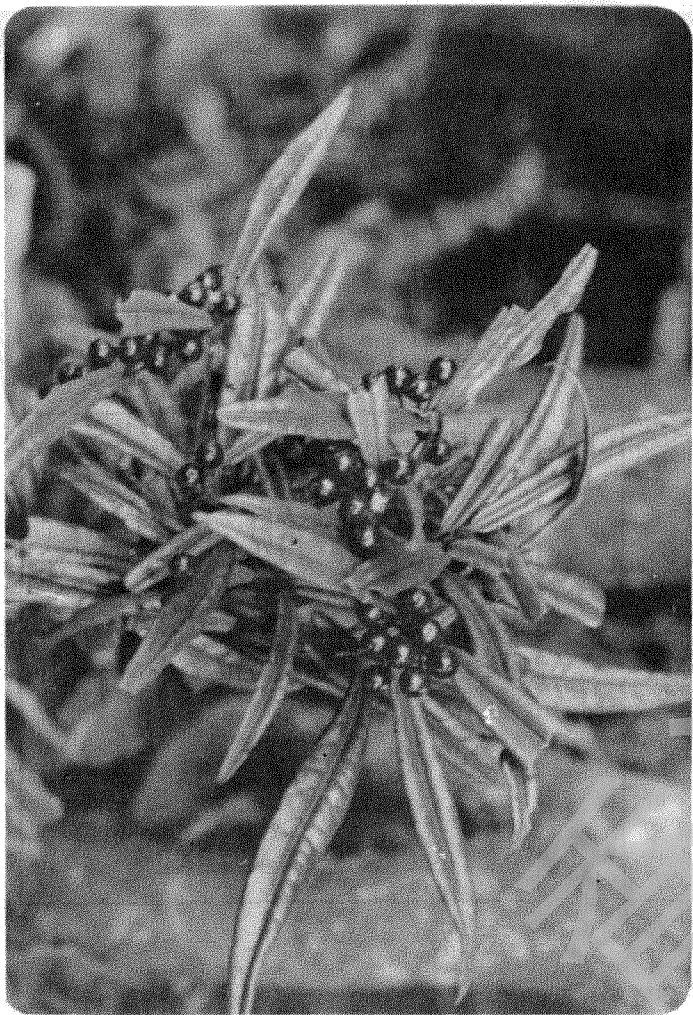
斑葉硃砂根、腺點紫金牛、沿海紫金牛