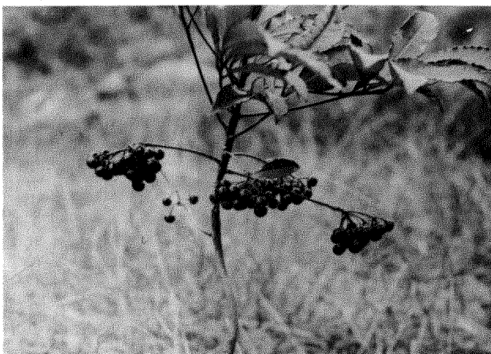
硃砂根之全株形態

直立禿淨不分枝灌木，高達1.5米。葉互生或近枝頂叢生，堅紙質，狹橢圓形至倒披針形，長8-13厘米，寬2-3.5厘米，緣皺波狀，兩面均緣有隆起的腺點。花期五、六月，為側生之繖形花序，花序長1.5厘米，近花序頂有數枚較少的葉片。花白色或淡紅色，長4-6毫米。果球形，直徑約6-8毫米，冬熟，朱紅色，有光澤，甚為可愛。