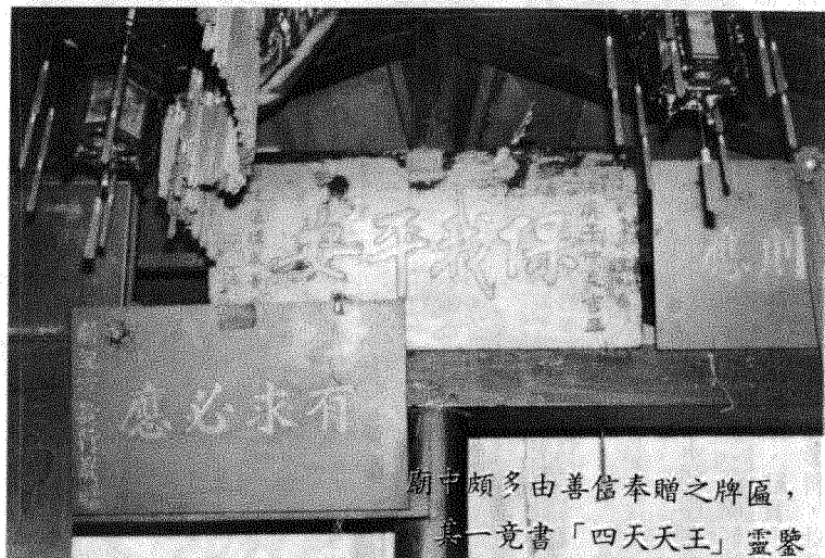
廟中頗多由善信奉贈之牌匾，其一竟書「四天天王」靈驗

出空隙，作為通風之用；況且小廟旁有一座大爐，作焚香之用，故此這一空隙，非常重要。「外廟」中間設有神台方案，四周木樑和牆壁上掛有一些牌匾、帳幔等，都是一些善男信女送出。最久的一塊牌匾，上書「保我平安」四字，於光緒庚子仲夏吉立。由此可證明歷史悠久。