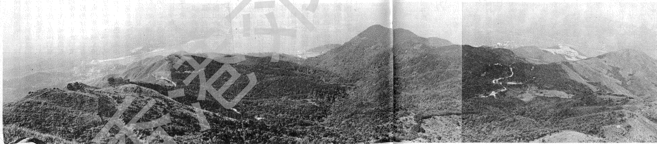
草山頂東北望，正 中林區為大埔灣松 仔園，遠景為大埔海