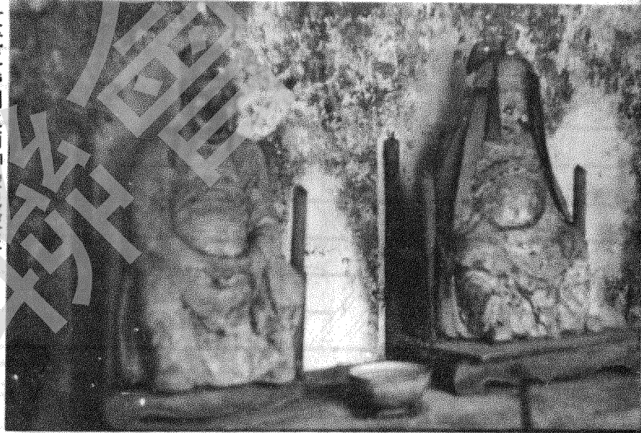
文武二帝側之兩神像已被盜 被盜北斗星君神像遺下之左手