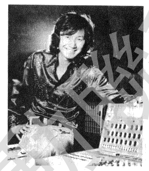
許冠傑國際歌迷會

郊遊露營 運送農作物至坪洲，行友如遇意外或中途氣力不支，可商借該艇轉往坪洲；大水坑與坪洲之間亦有街渡來往；若在修道院鄰近，可向該院商借車輛送到碼頭。若遇天氣驟變，嶼豐學校、大白與文學學校及修道院可作臨時庇護處。 名勝古跡 五鼓嶺(行友多誤花瓶頂為五鼓嶺)上可試找昔日張保仔瞭望台遺跡，並盡覽馬灣景色及汲水門形勢；青洲咀長岬美若蘇堤；花瓶石形如十字可試攀；扒頭鼓灣畔有船員罹難紀念碑；竹篙灣可小窺本港之造船業梗概；陰澳木排風光非別處可見；涉渡長索咀看導航燈塔；深水角據說為古代之瓦缸洲；大濠昔為屯兵之地；阿婆壟為鄰近最美之山村；望渡坳為主要之山隘；銀鑛瀑仍見秀美；銀鑛洞仍留一段傳奇；三、四兩白環境最寧謐；大興農場已見荒涼；虎白石澗泉豐石美；仙桃與車公鏡三石各擁奇姿； 修道院中一片靜穆；蟹地灣與萬角咀分別曾有古物出土；盲塘今已改稱橫塘。