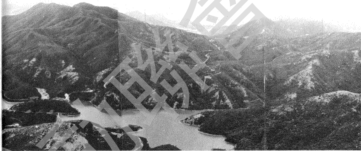
栢架山下瞰大潭四塘 栢架山上之建築物

栢架山高五三一公尺，為香港島上之第二高山，有北、南、東三峯，各隔一坳對立，形如筆架，故此山土名筆架山，栢架山則為英名，又此山一名駝峯，亦為英名，因此峯與南峯間之山坳較低陷，遠望如一駝峯，故有此稱。