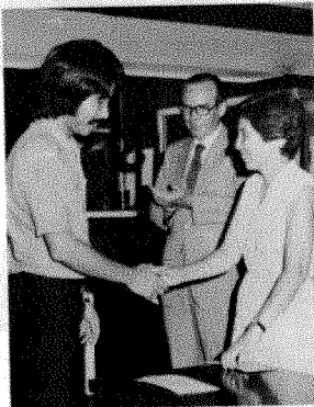
哈特臣夫人頒獎予各優勝者