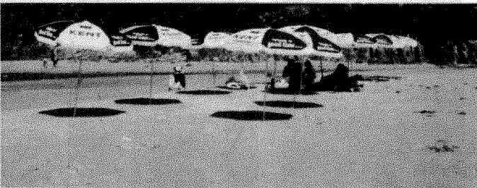
屆時灘上豎起之太陽傘