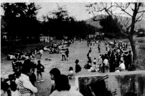
園內草坪廣闊，樹影婆娑