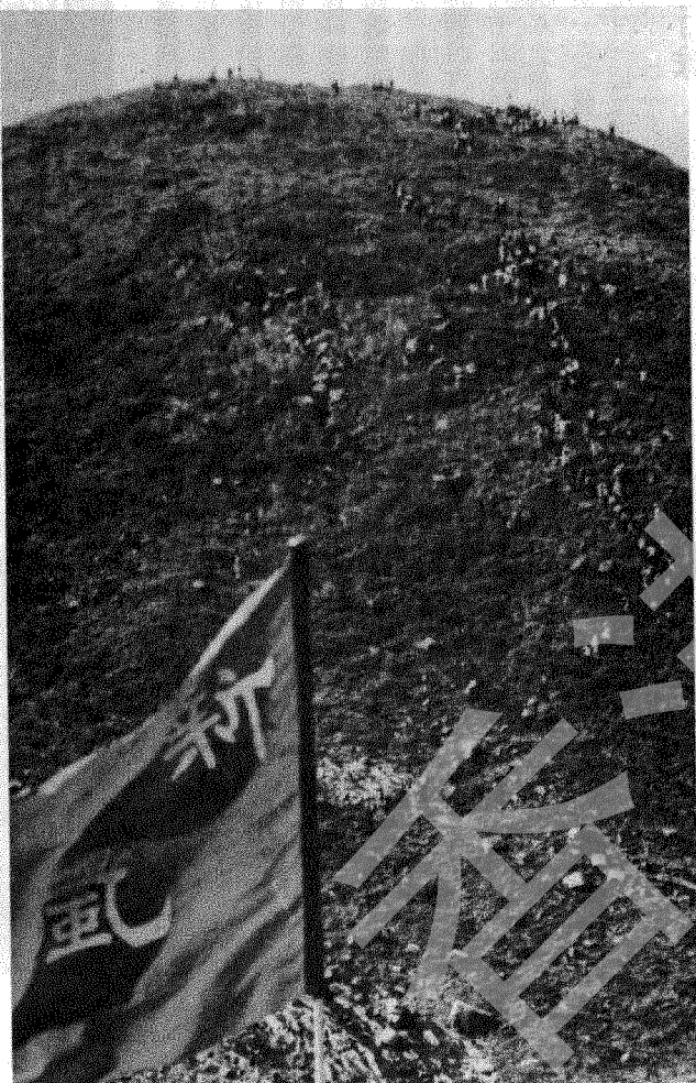
新風行友登糧船灣洲花山