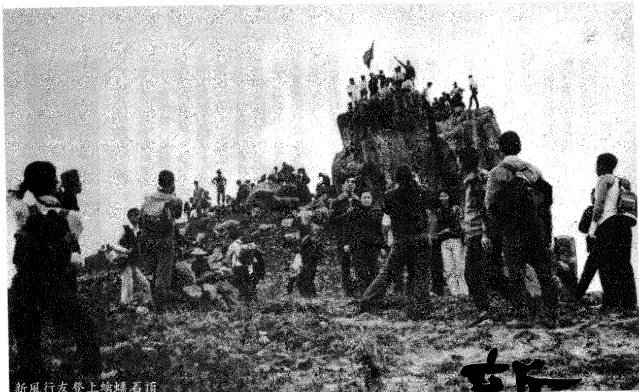
新風行友登上螞蟥石頂

「旅行安全問題」是一個非常嚴重的問題，深山廣海，危崖險澗隨時都會發生意外，郊遊首重安全，祇要保存一個完整的自我，假以時日，那怕山海之大，何處不可以留下足跡。完善的策劃與小心行事祇能把意外減至最低限度，但萬一事情發生了，還得設法善後，因此，「新風」早年更大力提倡行友參加救傷和拯溺訓練，以應付特殊意外事件，為旅行界提供更多方面的、更有效的服務，而且，目前已獲得很大的成就。