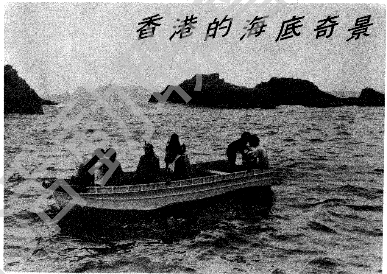
潛水人士在清水灣外海作下水前準備。