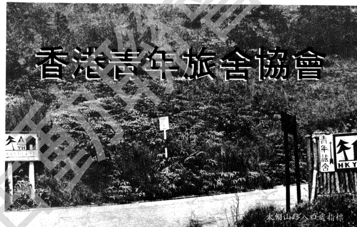
大帽山路入口處指標