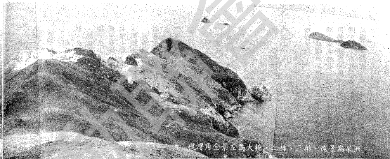
攪灣角全景左為大排，二排，三排，遠景為果洲