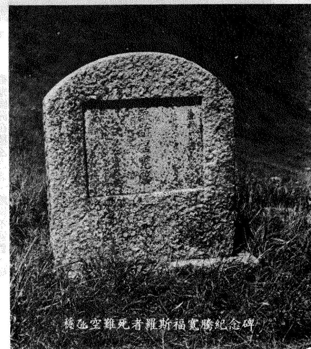
穩孟空難死者羅斯福寬勝紀念碑

北坡平順，多長草矮樹，南部則垂直斷裂，分為兩半，只在西端水面由一窄石堤相連，如遇潮漲，即為兩嶼，其間水道寬約丈許，兩坡壁立，其高聳與險峻情度，較破邊洲為甚，島之西北坡上脊上滿長矮樹荆棘，不易穿行，然為惟一可覽攪挽角洞之地點。 南部裂島，北坡固為直壁，其南坡亦為峭拔之裸露岩石，寸草不生，如層重疊，可供上下攀援，然極險峻，不可輕率而登。 北島外望，穩孟東首之石灣全現眼底，灣外石排似斷還連，隨水之漲退而隱現，山下海面，即為可供載客穿遊海蝕洞之大船停泊之唯一地點，遊客由此上落小艇，由艇家搖櫓來回盪遊。 斷崖以外，二排一字橫列，山坡如經斧削，近於垂直，島形尖銳如塔，左右均為直壁，直入水中，岩石凸凹，可以上落，危而不險，