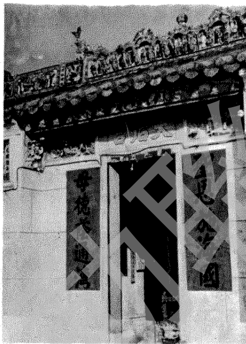
吉澳天后宮正門 樑上及橫額有陶塑甚多

吉澳島位於新界東北，東為大鵬灣，與平洲遙遙相對；南隔印洲塘，西鄰沙頭角海，與新界大陸相望；北可遙眺中國大陸沿岸風光。全島曲折折，海灣甚多，南段山上松林密佈，東澳海面掩影波光，其間名勝古蹟不少，實在是旅遊度假之好地方。每逢假日，油麻地小輪公司有水上的士由馬料水開往吉澳，船票須及早預訂。到了吉澳，最便捷的莫如參觀該處的村屋和廟宇。如西澳的天后宮，歷史悠久，建築瑰麗，最宜瀏覽；吉澳灣南的水月宮，前有深灣，波光瀲灩，足堪流連。此外，街頭巷尾，路旁水井亦築有不少神位，可見當地居民對中國流傳下來的神靈頗多信奉。現在首先介紹吉澳天后宮。