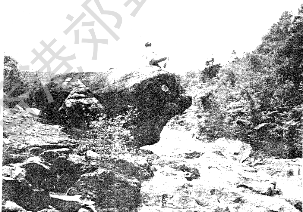
「屏南石澗」中段之肥豬石

龜頭嶺，或稱「大瀝嶺」；亦作「水門山」，蓋其西南出拋珠坑，而北出老龍坑，勢若一門之摒隔也。此山高四八六公尺，視屏風、