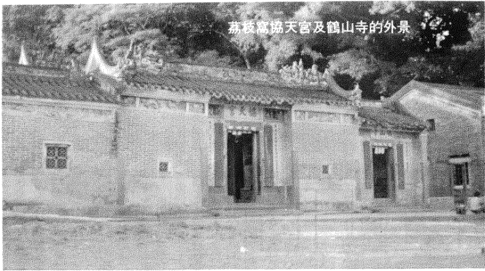
荔枝窩協天宮及鶴山寺的外景