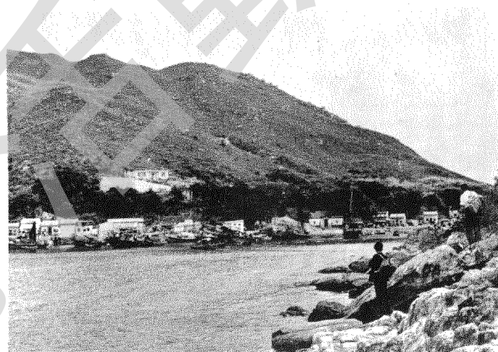
吊鐘洲「水出屎」(地名)北望濶西村

西貢羣嶼，西起近貼墟市之牙鷹洲，東止糧船灣洲東北角之破邊洲，北自黃竹灣畔之湖洲與斬竹灣內之橫洲，南訖清水灣半島大環頭岬角外之大小嶼，共計大小島嶼礁排六十有餘，其中最大一島為糧船灣洲，以次為濶西洲，為吊鐘洲，為橋咀洲，為伙頭墳洲，為穩乙，為甕缸，為牛尾洲等，自萬宜水庫興建以後，糧船灣洲北部連接陸地，已成半島，故濶西與吊鐘兩洲躍居第一、第二，兩洲各有附島小嶼，濶西以北各島之情況已在以前各編逐一介紹，本期論述濶西及吊鐘兩大島與濶西東南之礁排一執毛，吊鐘洲附近之匙洲，孖排及單排與位當牛尾海之牛尾洲各地圖文，將於下期刊出。