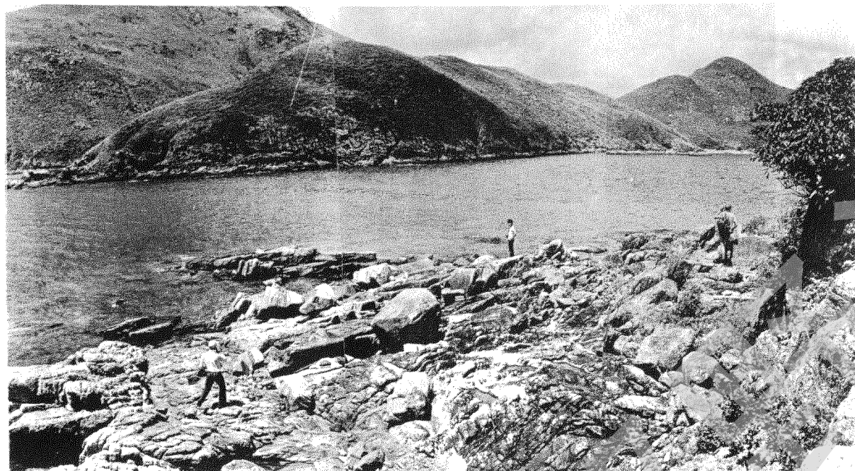
一執毛西岸，水下為美麗珊瑚

一執毛為一小礁排，在濶西東南濶中灣山咀一百四十碼外，正對糧船灣之螞蟥灣。此小嶼長六十碼，闊八十多碼，最高處為一石崗，高三十七呎，頂上面積不大，為一大岩石，矮樹密集，然無礙觀景。環岸均為礁石