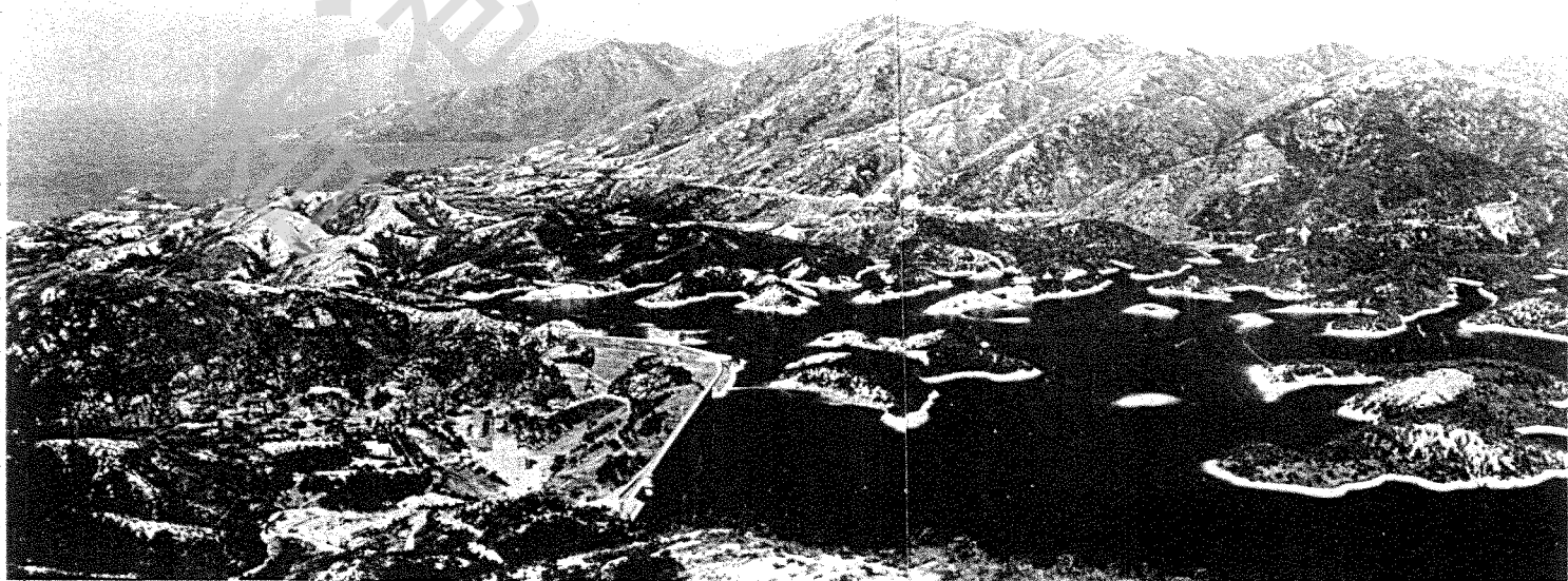
從桃坑峒望九逕山及大欖涌水塘

「紅水山在城南五十里周圍十餘里昔傳土人於此遇賊殲焉坑水盡赤故名上有龍船石二各長二丈許一覆一仰叩之聲如洪鐘其坑流十餘里田藉灌溉。」