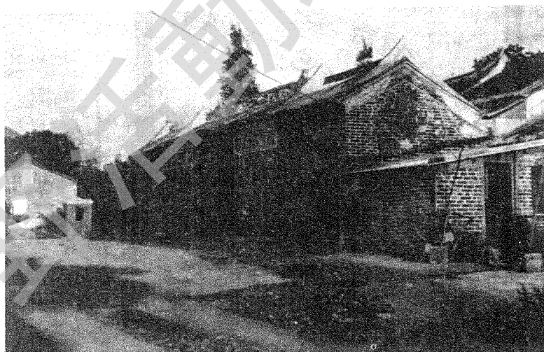
坪峯天后古廟正門