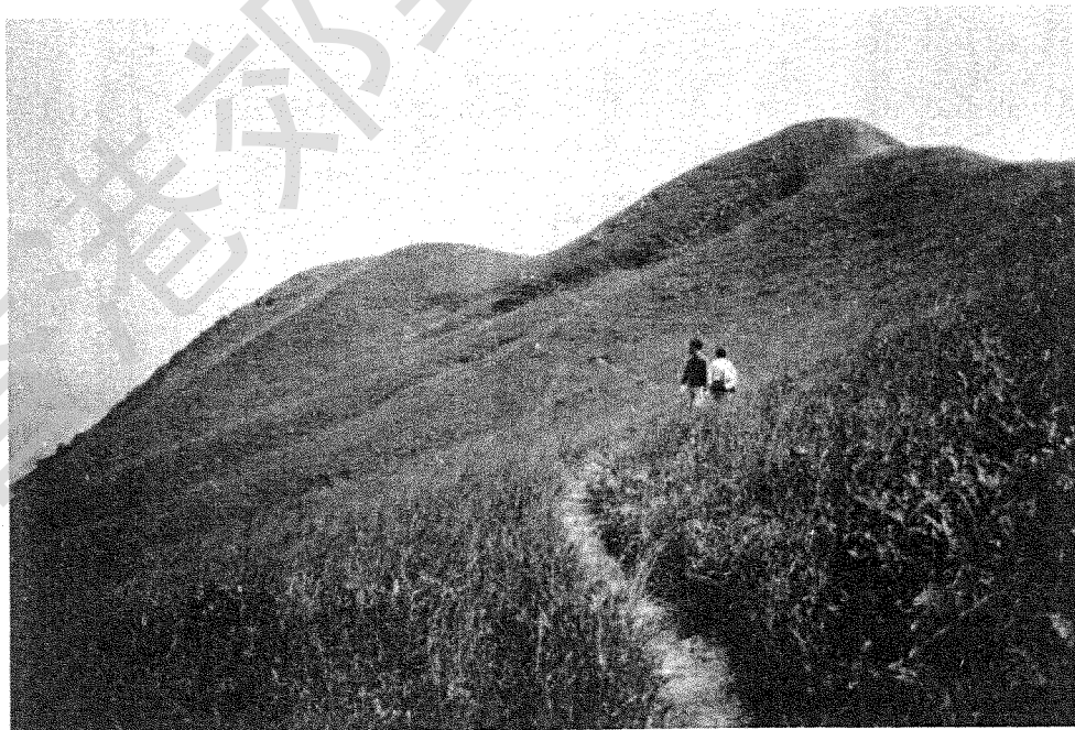
觀音峒北坡之山徑

跌死狗之東，一山兩峯，相峙而不突出，是為「鳳凰笏東頂」及「鳳凰笏西頂」，亦作「鳳凰尾」及「鳳凰頭」。東頂高二〇九公尺，西頂高二四一公尺。西頂之北，一水下注戶洲塘窩谷東首，山徑亦