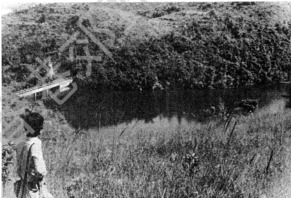
戶洲塘南坡之牛角涌水塘

遊紅石門，一般是從烏蛟騰、或九担租、或下苗田登「橫嶺」，東行至「觀音峒」東之「紅石門坳」下行入村。若遊戶洲塘，則於過紅石門坳後續登「石芽頭」峯，於「跌死狗」或「鳳凰笏」兩峯之間北下。回程一般過鹹魚埕、黃竹涌而走苗田，回烏蛟騰。迴環一匝，則橫嶺一脈已踏足過半；登高望遠，幽秘美勝兼而得之。故遊紅石門、戶洲塘，步行時間雖達六小時，然情味獨特，殊非易得也。