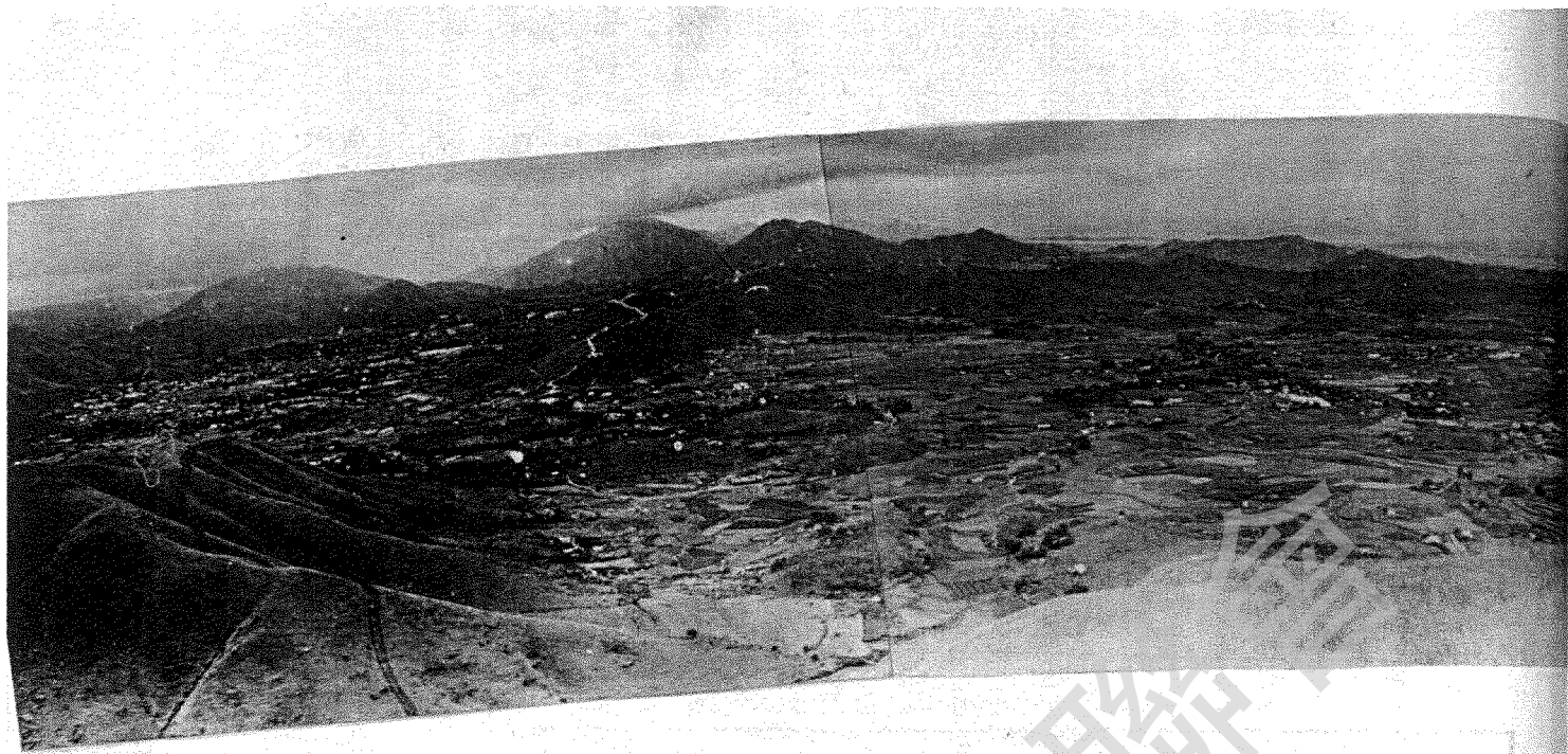
禾徑山上遠眺上水華山