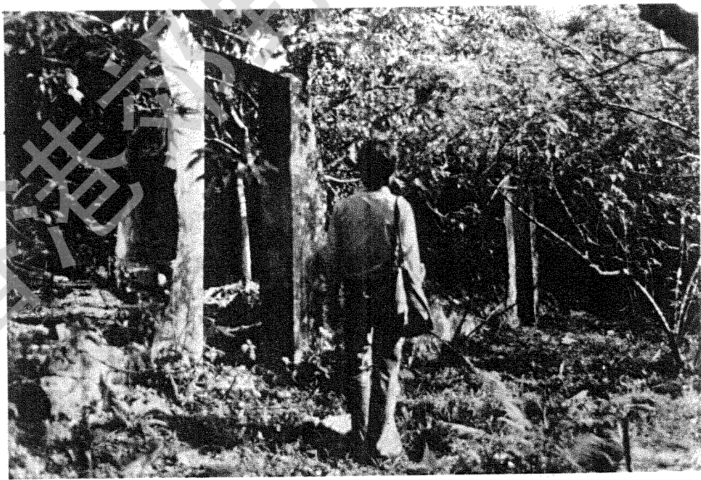
馬屎廢村僅存之門框

石水澗為一小高台，在狹谷之東端。東南高夾，西北略瀉。其地已無居人數十年。年前頽石牆基，依然約略；廢田規範，依稀宛約。小徑自谷中穿插，遊者每能盡意；今則什草高亂，舊物、山徑全失，唯見一片荒蕪，非知遊者不易辨別。谷之東側，一坑發自「石水澗」