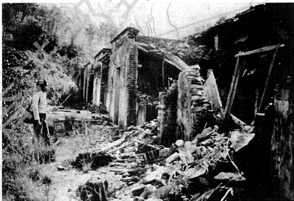
上苗田村之破敗村景